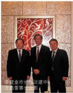
季建业市长会见贝氏工作团队

【本报讯】日前，美国贝氏建筑事务所贝建中董事长携工作团队来宁就汉府街地块概念设计方案与公司进行沟通，王勇董事长、戚良猛副总经理热情接待了贝氏工作团队。南京市市长季建业、市政府副秘书长、市规划局局长赵品夫、